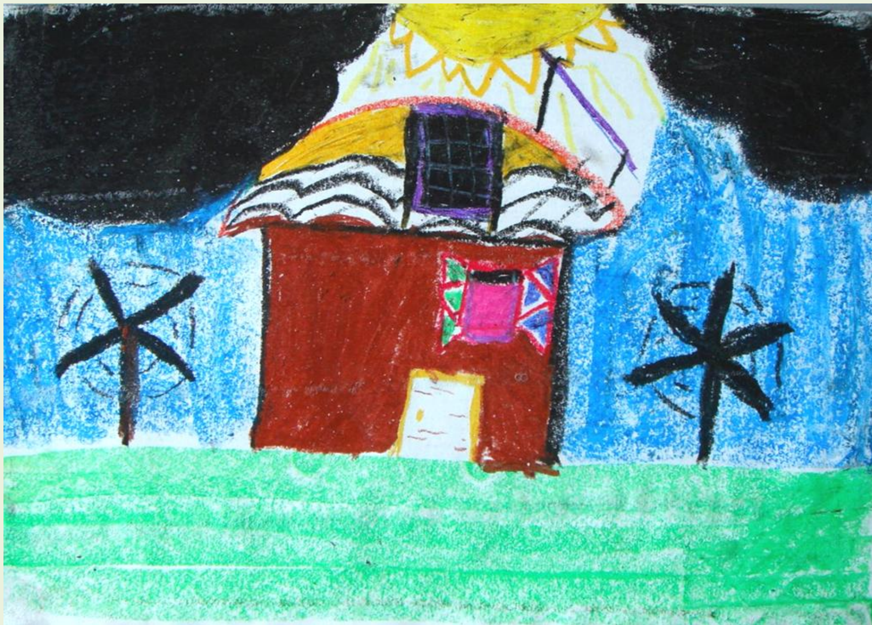
FINALISTA 1R CICLE: NIL MORALES