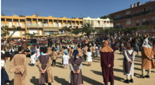
La Festa de la Malavella, el dia de la gent gran