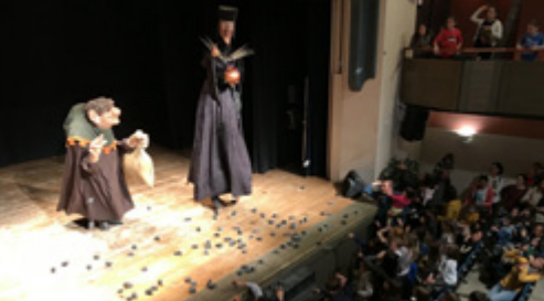
La Festa de la Malavella, el dia de la gent gran