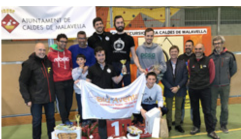
El Club Patinatge Artístic fa 10 anys

El dissabte 14 d'abril el polivalent de Caldes de Malavella es va convertir en la seu d'una nova prova d ela Copa Catalana de Raids. El mal temps va fer canviar lleugerament les proves havent de suspendre, per exemple, el tram amb patins de línia a l'alçada de la carretera de Santa Pellaia. Des de la organització es creu que el mal temps podria haver influït també en el nombre d'inscrits. El recorregut passava per Riudellots de la Selva, Campllong, Llambilles, Quart, Cassà de la Selva, Sant Sadurní de l'Ebre i Llagostera. Els equips RaidAventura.ORG, Aventura X-Perience i Micaco Raid van guanyar la prova.