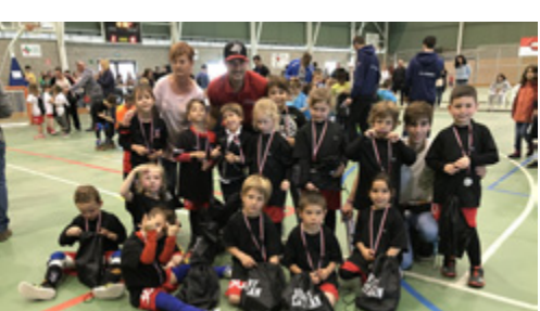
Baixen les ocupacions a Caldes

El passat diumenge 6 de maig el polivalent de Caldes de Malavella es va convertir en la seu d'una nova trobada d'equips d'escoleta d'Hoquei. En total 150 nens i nenes de 20 equips diferents de la zona van participar en la jornada. Al llarg del matí es van jugar una seixantena de partits entre equips com el Caldes, el GEIEG, el Girona CH, el Palafrugell, El Salt, el Shum, el Farners, el FD Cassanenc, l'All-stars Escoleta, l'Olot o el Lloret entre molts d'altres. Al migdia tots els nens i nenes participants van rebre una medalla de reconeixement.