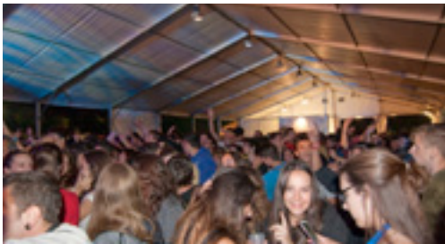
Festa Major 2016. Sopar popular

Ja la tenim a tocar! Arriba la Festa Major 2016 curulla d'activitats per a tots els gustos i edats. Com cada any, el cap de setmana anterior (29, 30 i 31 de juliol) escalfarà els motors amb un seguit d'actes que tindran continuïtat el dijous 4 d'agost amb el Gran sopar popular de Festa Major. A partir d'aquí, la festa ja no parará durant els dies 5, 6, 7, 8 i 9 d'agost. Si no us ha arribat ja, ben aviat rebreu el programa de la Festa Major i podreu seguir la programació detallada de les activitats. Volem agrair especialment als Joves Intrèpids la seva implicació en l'organització i coordinació de la Festa i als col·laboradors i entitats pel seu suport i per les activitats que organitzaran. Per acabar, només ens queda desitjar-vos una gran Festa Major!