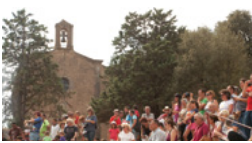
Entitat de Sant Maurici

El dijous 14 de juliol al Casino Municipal (19h), l'Ajuntament de Caldes de Malavella fa una convocatòria pública a entitats i vilatans que vulguin participar en la creació d'una nova entitat que tindrà l'objectiu de preservar el patrimoni material i immaterial de Caldes i, concretament, l'entorn del paratge de Sant Maurici. Hi poden participar les persones que ho vulguin, que s'estimin Sant Maurici o que sentin un vincle especial amb aquest espai tant estimat per tanta gent. L'estudi de casos similars a Sant Maurici en altres poblacions catalanes de gestió de patrimoni municipal i la destacadíssima implicació d'entitats i persones a títol particular amb la preservació de Sant Maurici ha portat a impulsar el sorgiment d'aquesta nova entitat.