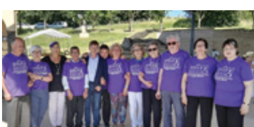
Festa del soci de la Casa Rosa

L'Associació de gent de la tercera edat “Casa Rosa” va organitzar la Festa del Soci el 17 de juny passat. Enguany va ser el segon en què la celebració es va fer a la pista coberta de Franciac, que oferia un molt bon aspecte. L'acte va consistir en un dinar de germanor i un ball. L'associació no en tenia prou i va organitzar també el dimecres 29 de juny una nova celebració: la revetlla de Sant Pere, amb sopar i novament ball. En aquest cas, la festa es va fer a la plaça de l'Aigua i va ser també molt concorreguda. Es pot considerar que els dos actes van ser un èxit, tant per la gentada com per l'animació. Agraïm a la junta dels avis de la Casa Rosa els actes que programen al llarg de l'any per a la gent gran. Els propers seran els de dimarts de la Festa Major, amb un ball-vermut al migdia, concert a la tarda i de nou ball al vespre.