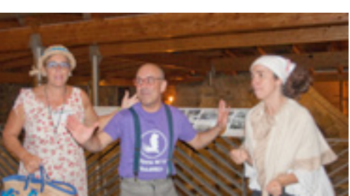
Grup de teatre Els Guies Ufissials

Podreu veure'ls el 13, 20 i 27 d'agost i el 3,10,17 i 24 de setembre a les 10 de la nit. A la sessió inaugural us lliurarem un obsequi commemoratiu i bufarem les espelmes d'un pastís d'aniversari. Feu la reserva aviat perquè les places són limitades! Més informació, a l'Oficina de Turisme (972 48 01 03).